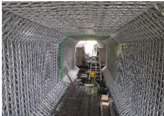
[グリッドメタル設置] 展張型6mm(亜鉛めっき仕様)のグリッドメタルをコンクリートアンカーにて固定