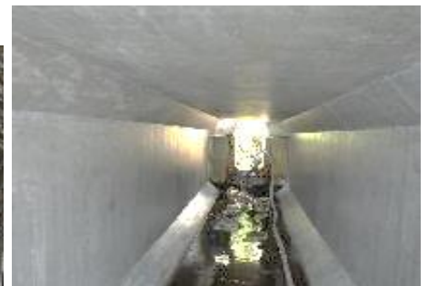
[施工完了] ①吹き付けモルタル: SSI工法(塩害対策用)を施工、かぶり厚は20mm ②表面被覆はアイゾールEXを塗布。