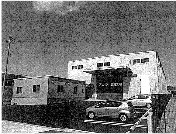
竣工した碧海工場