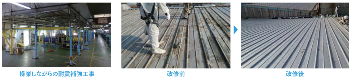
操業しながらの耐震補強工事