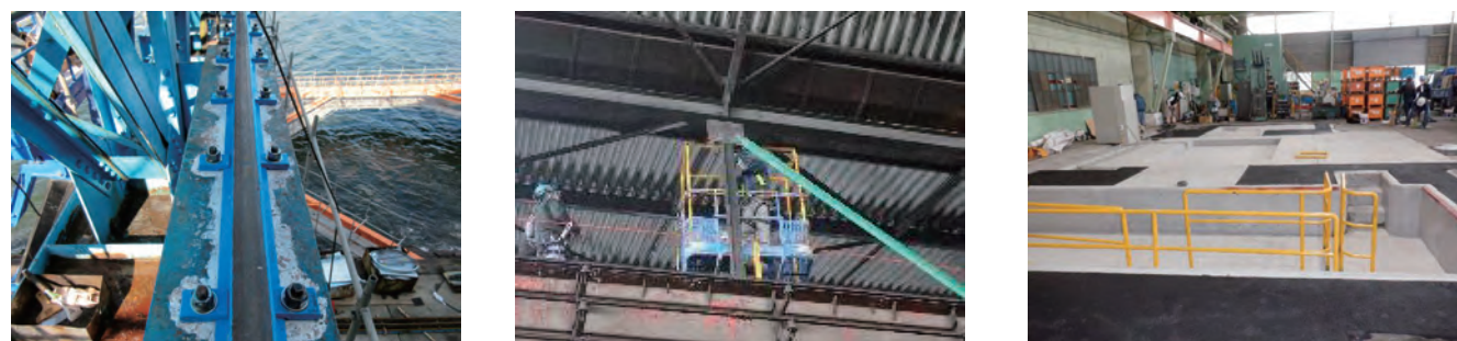
クレーンガーターの補修、耐震補強工事、機械基礎建設等、工場特有の工事計画に自信があります。