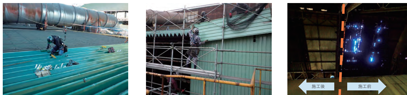
腐食した屋根外壁の更新工事の様子です。工場稼働を極力優先し、安全な施工を計画しました。

『事業予算作成の為に計画協力』からお気軽にご相談ください 工場改修のプロフェッショナルとして、状況に適した施工をご提案致します