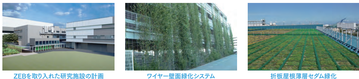
ZEBを取り入れた研究施設の計画