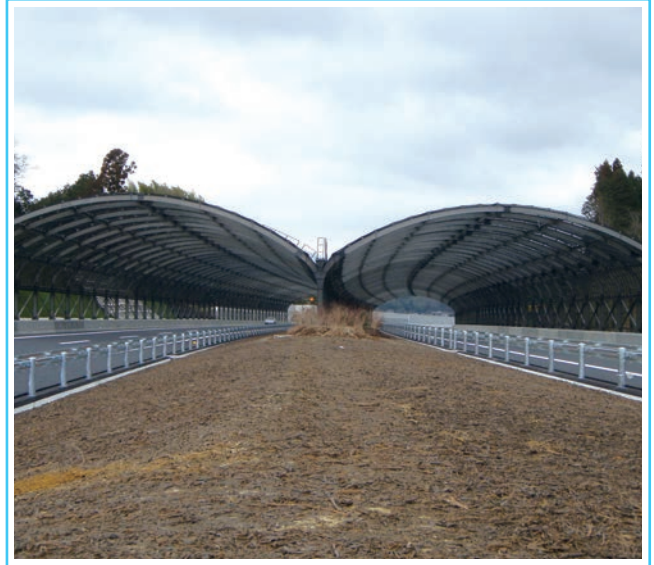
新名神自動車道シェルター