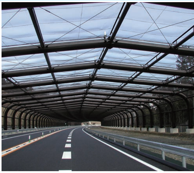
東海環状シェルター